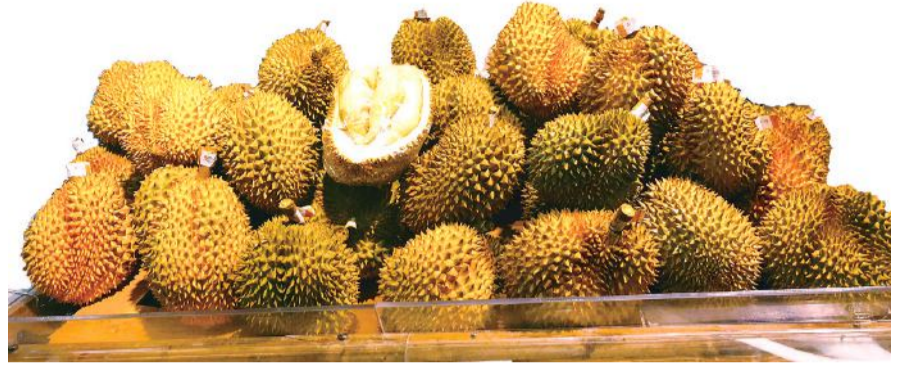
泰国树熟美味开盖即食够滋味