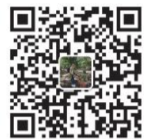
小伟哥带你吃榴莲