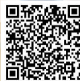
扫一扫，听《鱼歌》 作曲 苗子、林达 作词 黄澄澄、林达 改编 徐聪、丁丁、黄馨飞

这是周六下午3点，气温30℃，厦门已经入夏，知了声此起彼伏。厦门六中的六中合唱团，这个青春的小网红，正在高中部进行录音排练。参加合唱团录音的孩子总共12人，只有3个男生，他们主要负责低声部的演唱。今天，这群孩子换上整洁的制服，雪白衬衫马尾辫，百褶裙下白色布鞋。