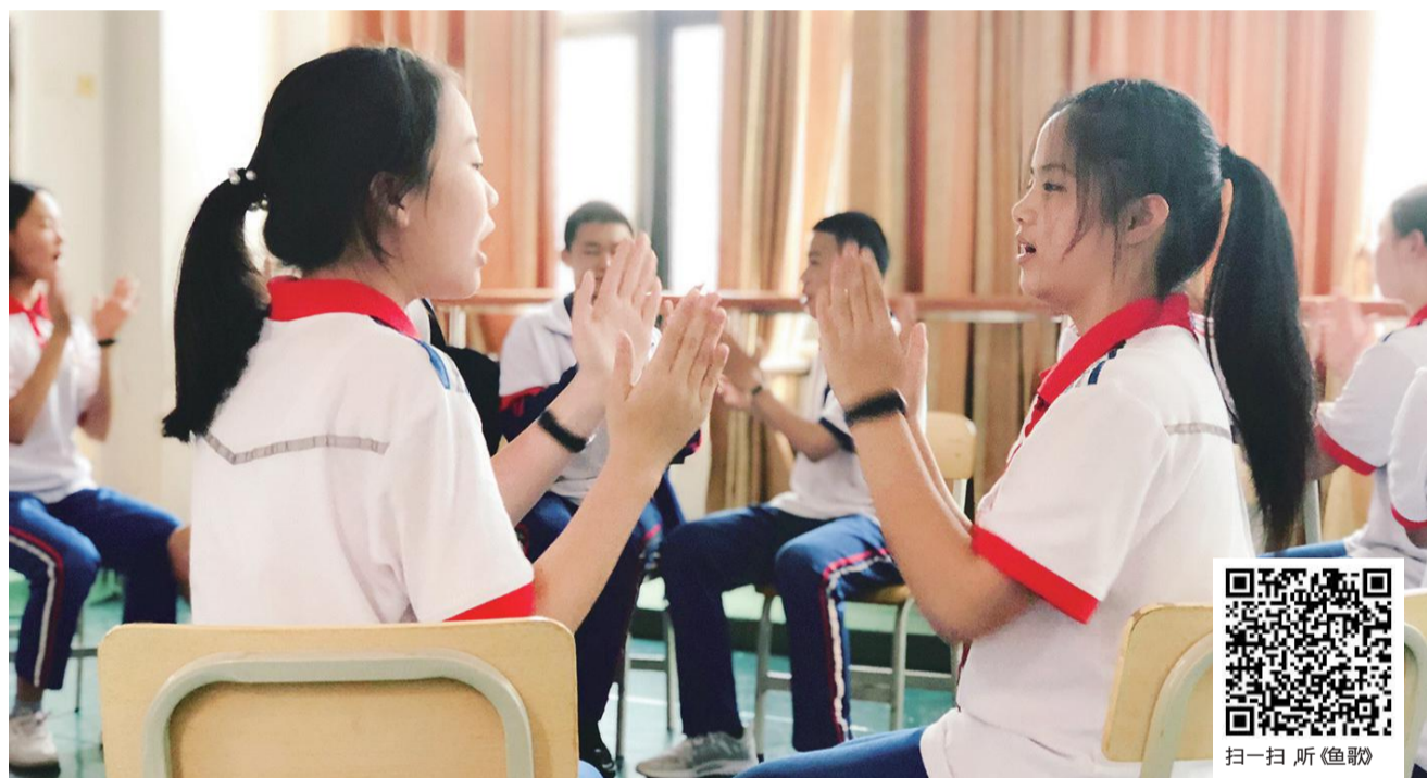
厦门六中室内合唱团始建于1996年，现役40多位团员均由热爱音乐的在校生组成。合唱团秉承“普及室内合唱艺术、提升学生艺术审美与音乐素养”为宗旨，广泛涉猎不同语言不同风格的优秀合唱作品，并坚持原文演唱。